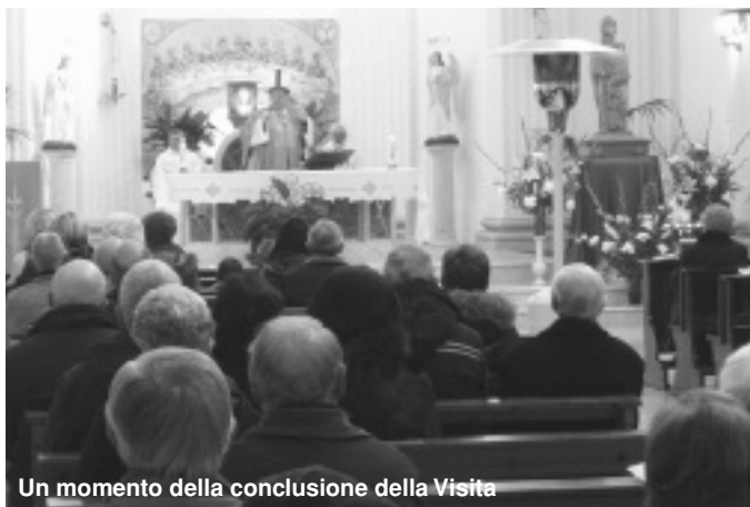
Un momento della conclusione della Visita

Questa Visita, aspettata e preparata con i Centri di Ascolto del Vangelo nelle case e nelle famiglie e la peregrinatio mariae della copia della Madonna della Mentorella, è stata un momento di condivisione e di paternità da parte del Vescovo, l'ultima Visita pastorale risaliva ormai a 25 anni fa.